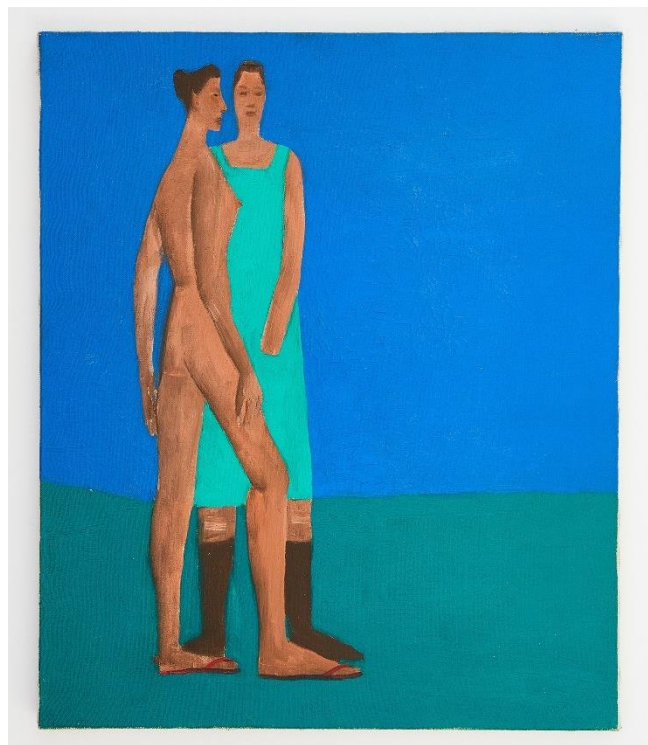
Marc Desgrandchamps, Sans titre , 1989 huile sur toile, 64 x 45 cm

Petit à petit, la collection s'enrichit et compte aujourd'hui autour de 150 œuvres. Si certaines peintures ont fait l'objet de prêts occasionnels, la collection n'a jamais été exposée à ce jour. Cette sélection de 19 peintures, présentée à la Villa Beatrix Enea, s'offre une première diffusion dans un lieu public.