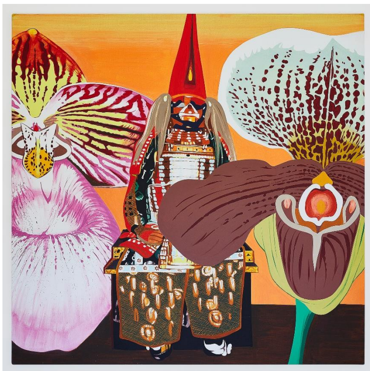
Bernard Rancillac, Cérémonie de jour , 2007 acrylique sur toile, 200 x 200 cm

1937, Port-au-Prince (Haïti) – 2022, Ivry-sur-Seine (France)