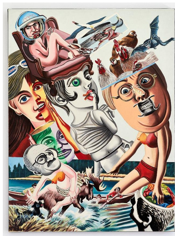
Erró, Brain Touch , 1970 acrylique sur toile, 130 x 97 cm