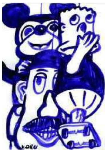
LES COLLECTIONS DU MIAM 2021 © HERVÉ DI ROSA

Membre incontournable du mouvement de la Figuration libre, Hervé Di Rosa défriche et collectionne les arts modestes depuis la fin des années 1980. Derrière cette formule se bouscule tout un territoire aux frontières vagues qui touche à l'art populaire, à l'art brut comme à l'art primitif sans jamais s'y réduire. Manufacturés ou artisanaux, sériels ou uniques, les objets de l'art modeste déroulent un inventaire à la Prévert où se rencontrent aussi bien des boules de neige que des figurines en sucre, des enseignes peintes, de l'art saint-sulpicien ou des cadeaux Bonux. Généralement sans grande valeur marchande mais à forte plus-value émotionnelle, ces créations étranges et marginales dévoilent toutes leurs facettes au sein du musée qui leur est dédié. Installé à Sète, le MIAM (Musée international des arts modestes) fait escale au centre d'art contemporain de la ville d'Anglet dans une exposition où s'entremêlent l'œuvre de Di Rosa et une partie de ses fabuleuses collections.