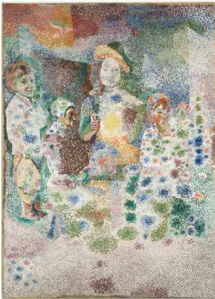
Pablo Picasso (1881-1973) : « Le Retour du baptême d'après Le Nain » (1917).