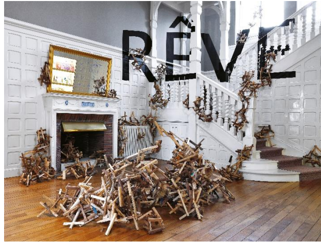
Have you got any matches ? , 2002, bois d'allumage, env. 5 000 chevilles, dimensions variables. Do you want to be part of a world of sleeping people ? , 2021, miroir, 93 x 145 cm. Production Ville d'Anglet – Centre d'art contemporain La Villa Beatrix Enea

Pour autant, l'artiste ne baisse pas la garde. Car la menace -illusoire- n'est peut-être pas loin. Dans le hall, déjà, quelque 5 000 chevilles et bois d'allumage s'amoncellent au centre de la pièce, débordent de la cheminée, se répandent dans la salle voisine, grimpent à même les murs et l'escalier, se propagent, envahissent, dans un élan de contamination irréprouvable. Have you got any matches ? interroge l'artiste non sans humour. Trônant au-dessus de la cheminée, le miroir semble prolonger à l'infini cette terrible invasion et lance une mise en garde : Do you want to be part of a world of sleeping people ? Dans le sous-sol de la villa, dévorant, engloutissant sans relâche, le feu ravageur est lui bien là, dans les vidéos où l'artiste se met en scène dans une performance destructrice et libératrice à la fois. Il est temps de réagir.