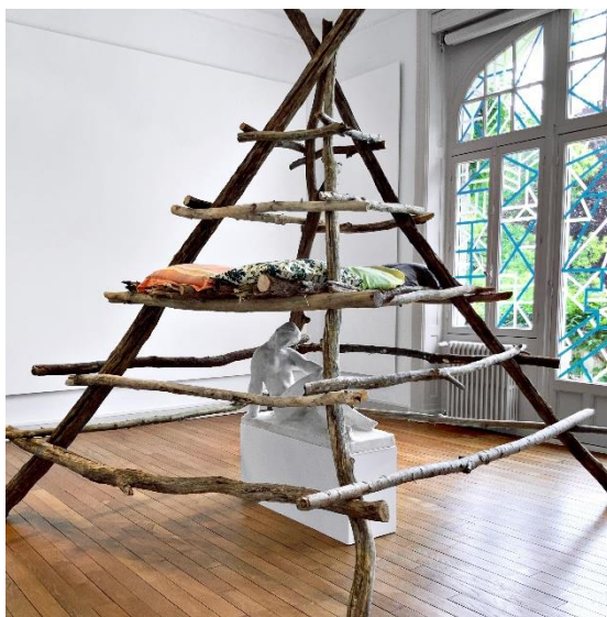
Tipi , 2021, bois flotté, branchages, vis, taies d'oreillers, sable, sculpture sur socle d'Édouard Cazaux, La Marne , vers 1950, plâtre, 66 x 105 x 34 cm, don de Mireille Charon-Cazaux, fille de l'artiste, pour la collection d'art contemporain de la Ville d'Anglet. Production Ville d'Anglet – Centre d'art contemporain La Villa Beatrix Enea

protection dérisoire mais symbolique avant tout.