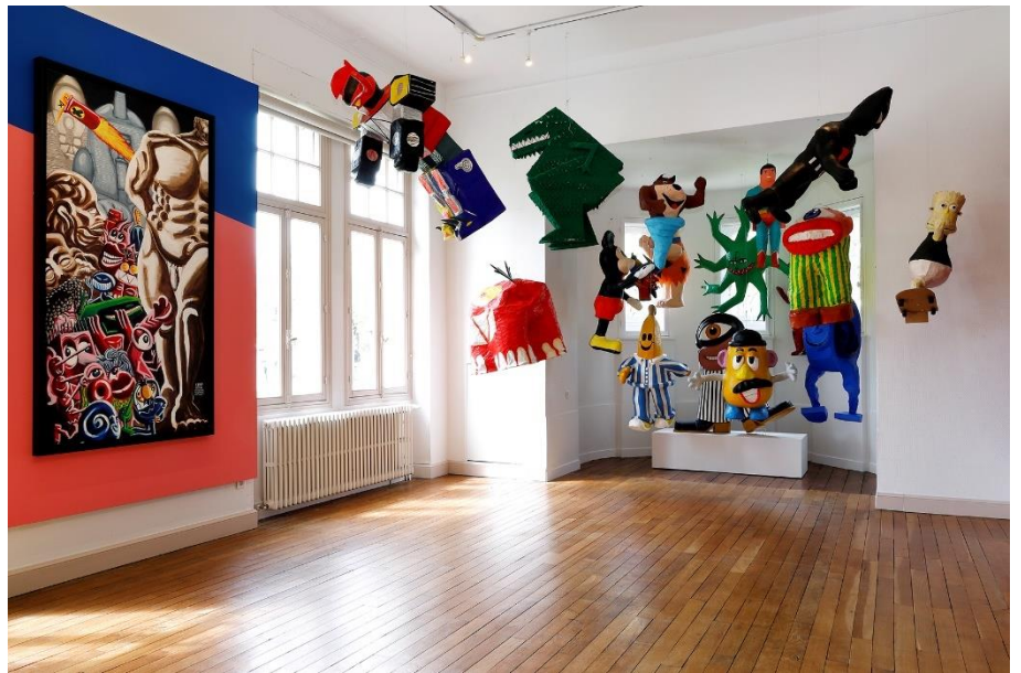
Mur gauche : HERVÉ DI ROSA, Sculptures antiques , 2017, acrylique sur toile, 216 x 114 cm.

Il est également l'auteur ou le sujet de plus de 150 livres d'art et publications entre 1978 et 2022. Depuis 1981, son œuvre qui a fait l'objet de plus de 200 expositions personnelles est présente dans d'importantes collections publiques et privées en Europe, en Amérique et en Asie.